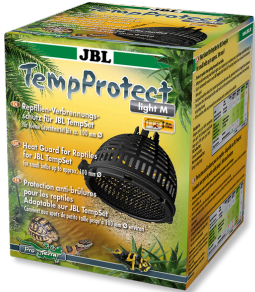
JBL TempProtect light Protection antibûlure pour reptiles pour JBL TempSet