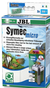
JBL Symec micro Microfibre pour filtre d'aquarium contre l'eau turbide