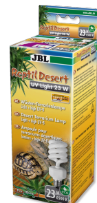
JBL ReptilDesert UV Light

Spot halogène à spectre complet de lumière naturelle