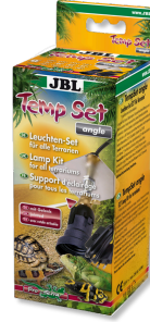
JBL TempSet angle Kit d'installation pour spot de terrarium