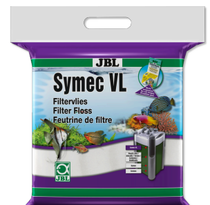
JBL Symec VL Microfibre filtrante contre toutes turbidités de l'eau