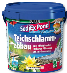
JBL SediEX Pond Bactéries et oxygène actif pour dégrader les boues