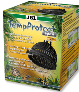
JBL TempProtect light Protection antibrûlure pour reptiles pour JBL TempSet