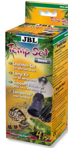
JBL TempSet basic Kit d'installation pour spot de terrarium