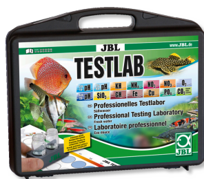
JBL Testlab Coffret de 13 tests pour analyse de l'eau douce