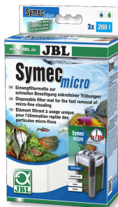
JBL Symec micro Microfibre pour filtre d'aquarium contre l'eau turbide