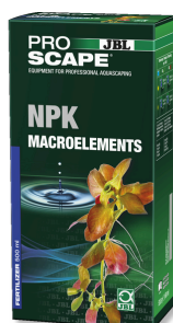
JBL PROSCAPE NPK MACROELEMENTS Engrais végétal à 3 composants pour aquascaping