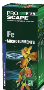
JBL PROSCAPE Fe + MICROELEMENTS Engrais végétal de base pour aquascaping