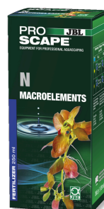
JBL PROSCAPE N MACROELEMENTS Engrais végétal à l'azote pour aquascaping