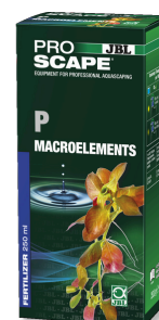
JBL PROSCAPE P MACROELEMENTS Engrais végétal au phosphore pour aquascaping