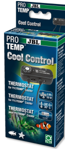
JBL PROTEMP CoolControl

Thermostat zur Steuerung von Kühlgebläsen