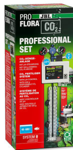
JBL PROFLORA CO2 PROFESSIONAL SET U CO2-Pflanzendüngeranlage-Komplettset + CO2-pH-Steuerung