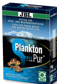
JBL PlanktonPur SMALL Leckerbissen für kleine Aquarienfische