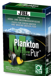
JBL PlanktonPur MEDIUM Leckerbissen für große Aquarienfische