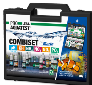
JBL PROAQUATEST COMBISET Marin Testkoffer für Wasseranalysen in Meerwasseraquarien