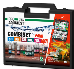
JBL PROAQUATEST COMBISET POND Testkoffer für Wasseranalysen im Koi- und Gartenteich