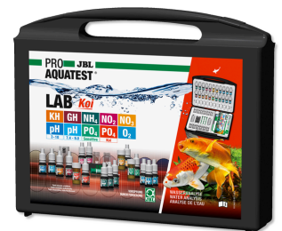
JBL PROAQUATEST LAB Koi Professioneller Testkoffer für Koi- und Gartenteich