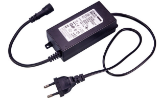
JBL LED SOLAR Driver