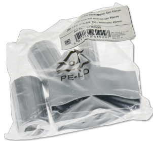
JBL LED SOLAR Endkappen Set