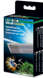
JBL LED SOLAR Hanging Seilaufhängung für JBL LED SOLAR Leuchten