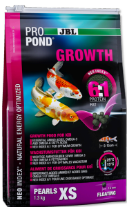
JBL PROPOND GROWTH XS