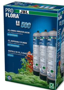
JBL PROFLORA 3 x u500 CO2-Einweg-Vorratsflasche