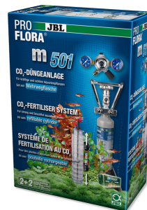
JBL PROFLORA m501 CO2 Komplettsset- Aquariumpflanzendüngeranlage