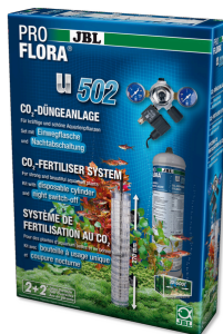
JBL PROFLORA u502 Pflanzendüngeranlage mit Nachtabschaltung