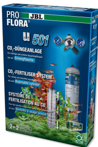
JBL PROFLORA u501 Komplettsset- Pflanzendüngeranlage