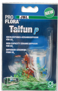
JBL PROFLORA Taifun P Mini-CO2-Diffusor für Nano- Süßwasser-Aquarien