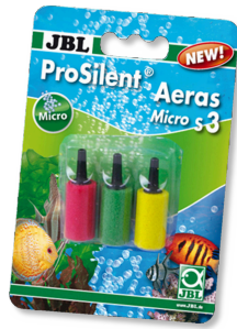
JBL ProSilent Aeras Micro S3 Ausströmerstein-Set für feine Luftblasen in Aquarien