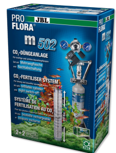
JBL PROFLORA m502 Aquariumpflanzen-CO2 Düngeranlage mit Nachtabschaltung