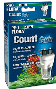
JBL PROFLORA CO2 Count Safe Blasenähler mit Rücklaufsicherung