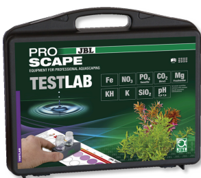
JBL Testlab ProScope Testkoffer zur Wasseranalyse in Pflanzenaquarien