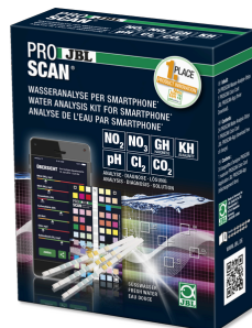
JBL PROSCAN Wassertest mit Smartphoneauswertung