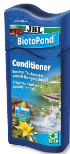
JBL BiotoPond Wasseraufbereiter für Teiche