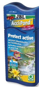
JBL AccliPond Wasseraufbereiter für Teich