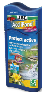
JBL AccliPond Wasseraufbereiter für Teich