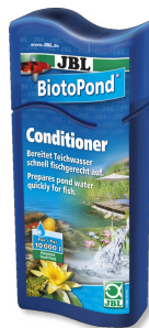
JBL BiotoPond Wasseraufbereiter für Teiche