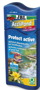
JBL AccliPond Wasseraufbereiter für Teich