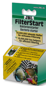
JBL FilterStart Bakterien zur Aktivierung von Filtern