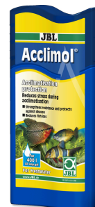
JBL Acclimol Wasseraufbereiter zur Neueingewöhnung