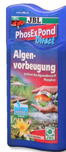
JBL PhosEx Pond Direct Phosphatentferner für Teich