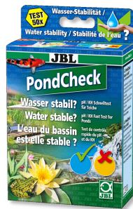
JBL PondCheck Schnelltest zur Bestimmung von pH- und KH-Wert