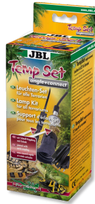
JBL TempSet angle+ connect Installationsset für Terrarien- Strahler