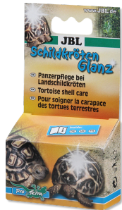
JBL Schildkrötenglanz Panzerpflege für Landschildkröten