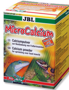
JBL MicroCalcium Mineralien-Ergänzungsfutter für alle Reptilien