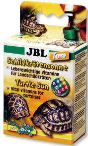
JBL Schildkrötensonne Terra Vitamine für Landschildkröten