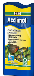
JBL Acclimol Wasseraufbereiter zur Neueingewöhnung