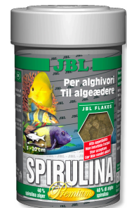
JBL Spirulina Premium Hauptfutter für Algenfresser im Aquarium