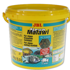
JBL NovoMalawi Hauptfutterflocken für algenfressende Buntbarsche