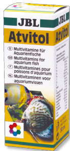
JBL Atvitol Multivitaminropfen für Aquarienfische