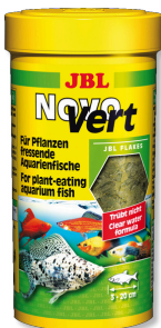
JBL NovoVert Hauptfutterflocken für pflanzenfressende Fische