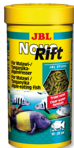
JBL NovoRift Hauptfuttersticks für aufwuchsfressende Buntbarsche