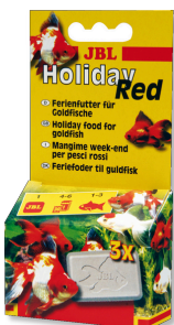
JBL Holiday Red Ferien-Alleinfutter für Goldfische