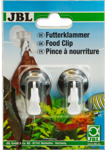
JBL Futterklammer Universalklammer für Futter und Salatblätter