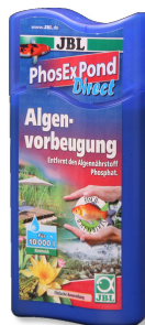
JBL PhosEx Pond Direct Phosphatentferner für Teich