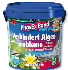
JBL PhosEx Pond Filter Phosphatentferner für Teichfilter