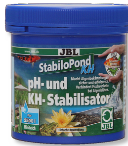
JBL StabiloPond KH PH-Stabilisator für Gartenteiche