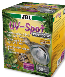
JBL UV-Spot plus UV-Spotstrahler mit Tageslichtspektrum für Terrarien