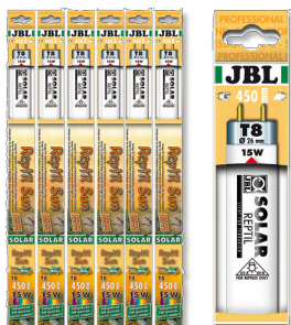
JBL SOLAR REPTIL SUN T8 T8 Spezial-Terrarienleuchtstoffröhre für Wüstentiere