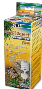
JBL ReptilDesert UV Light Energiesparlampe für Wüstenterrarien