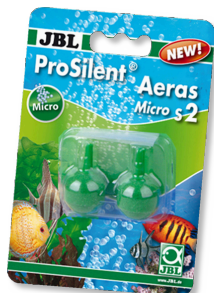
JBL ProSilent Aeras Micro S2 Kugelausströmersteine für feine Luftblasen in Aquarien