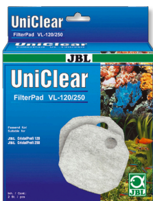
JBL FilterPad VL Wattelies für Aquarienfilter CristalProfi