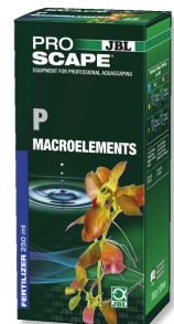
JBL PROSCAPE P MACROELEMENTS Phosphor-Pflanzendünger für Aquascaping