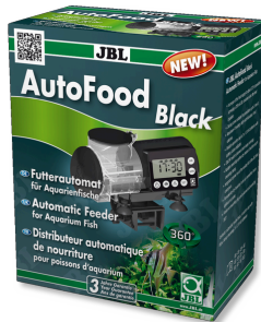
JBL AutoFood BLACK Schwarzer Futterautomat für Aquarienfische