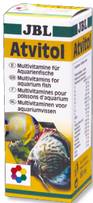
JBL Atvitol Multivitaminropfen für Aquarienfische