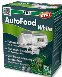
JBL AutoFood WHITE Weißer Futterautomat für Aquarienfische