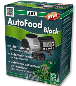
JBL AutoFood BLACK Schwarzer Futterautomat für Aquarienfische