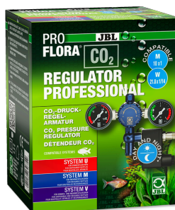
JBL PROFLORA CO2 REGULATOR PROFESSIONAL Regulátor tlaku s 2 displeji a magn. ventilem pro CO2