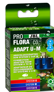
JBL PROFLORA CO2 ADAPT U - M Adaptér pro přestavbu jednor. lahvi CO2 na plnitelné