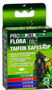
JBL PROFLORA CO2 TAIFUN SAFESTOP Pojistka proti zpětnému toku pro zařízení CO2