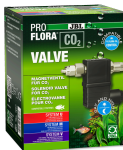
JBL PROFLORA CO2 VALVE CO2 magn. ventil pro kontrolu přivádění CO2