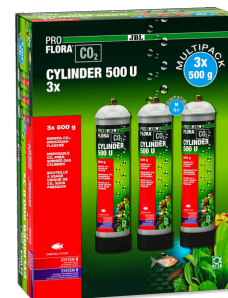
JBL PROFLORA CO2 CYLINDER 500 U 3x Jednorázová lahev 500 g s CO2 (výhodný set 3 ks)