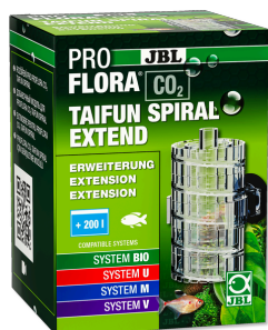
JBL PROFLORA CO2 TAIFUN SPIRAL EXTEND Rozšíření pro JBL PROFLORA CO2 TAIFUN SPIRAL 5 / 10