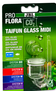
JBL PROFLORA CO2 TAIFUN GLASS Skleněný difuzér CO2 pro sladkovodní akvária 40-300 l