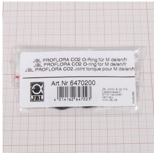
JBL PROFLORA CO2 O kroužek pro M