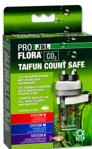
JBL PROFLORA CO2 TAIFUN COUNT SAFE CO2 počítadlo bublin s pojistkou proti zpětnému toku