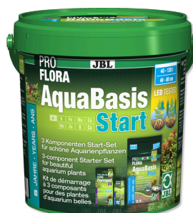
JBL PROFLORA AquaBasis Start Hnojivo rostlin - start. sada pro sladkov. akvária