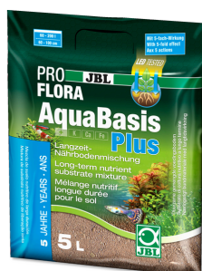
JBL PROFLORA AquaBasis plus Dlouhodobá živná půda pro sladkovodní akvária