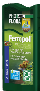
JBL PROFLORA Ferropol Rostlinné hnojivo pro sladkovodní akvária