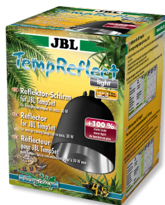
JBL TempReflect light Žárovka pro energeticky úsporné zářiče