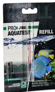
JBL PROAQUATEST K trubička