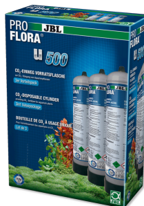
JBL PROFLORA 3x u500 Jednorázová CO2 láhev