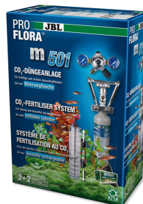
JBL PROFLORA m501 Kompletní sada hnojícího zařízení pro rostliny CO 2