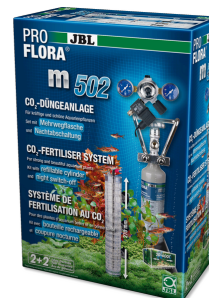
JBL PROFLORA m502 Hnojící zařízení s nočním vypínáním CO 2 pro rostliny