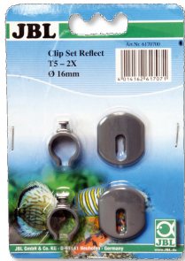
JBL SOLAR REFLECT sada klipů Držák zářivky