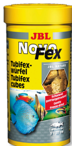
JBL NovoFex Tubifex cubes, pamlsky pro akvarijní ryby