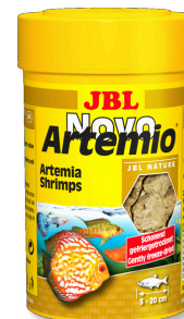
JBL NovoArtemio Doplňkové krmivo pro všechny akvarijní ryby artemia