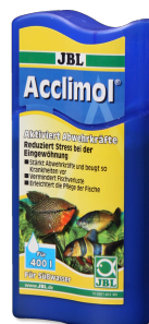
JBL Acclimol Přípravek k úpravě vody k aklimatizaci