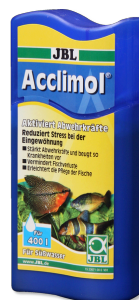
JBL Acclimol Přípravek k úpravě vody k aklimatizaci