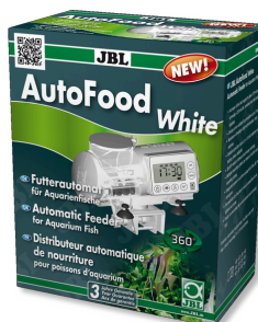
JBL AutoFood WHITE Bílý zakrmovací automat pro akvarijní ryby