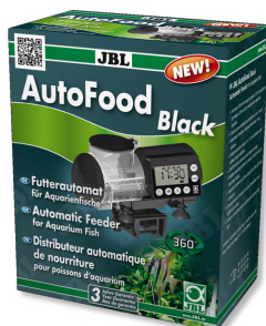
JBL AutoFood BLACK Černý zakrmovací automat pro akvarijní ryby