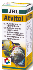
JBL Atvitol Multivitamin pro akvarijní ryby, kapky